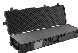
1770WF With Foam