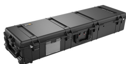
1770NF No Foam