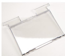
1630DC Accessoire conteneur de documents