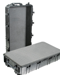
1780WF With Foam