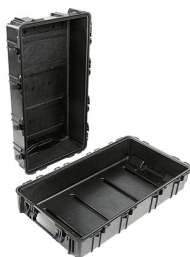
1780NF No Foam