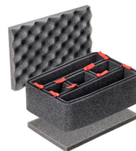
1120TPKIT Kit de séparation de la valise TrekPak