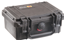
1120NF No Foam