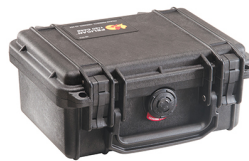
1120NF No Foam