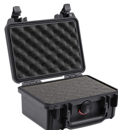
1120WF With Foam