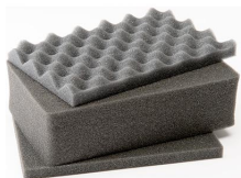
1121 Jeu de mousses de rechange, 3 pièces