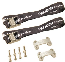
TDKIT Trousse de fixation