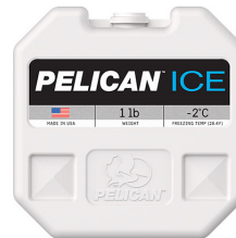
PI-1LB Bloc réfrigérant 1 lb