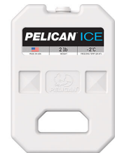
PI-2LB Bloc réfrigérant 2 lb