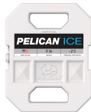
PI-5LB Bloc réfrigérant 5 lb