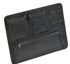
1569 Pochette couvercle