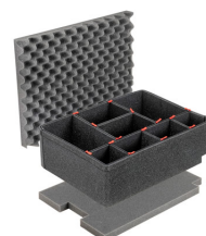
1560TPKIT Kit de séparation de la valise TrekPak