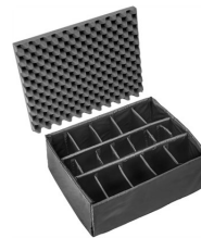
1615 Cloison en mousse