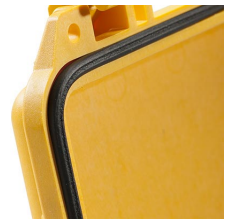
1623 Joint torique de remplacement