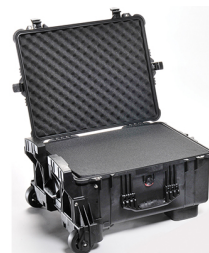
1610MWF With Foam