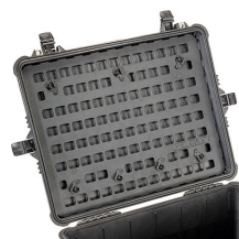
1610MP EZ-Click™ MOLLE Panel