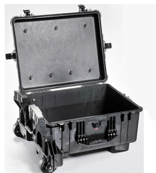
1610MNF No Foam