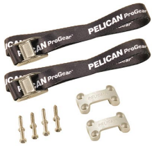
TDKIT Trousse de fixation