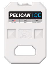
PI-2LB Bloc réfrigérant 2 lb