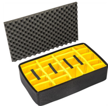
1675 Cloison en mousse