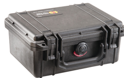
1150NF No Foam