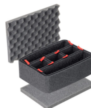
1150TPKIT Kit de séparation de la valise TrekPak