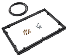
1150PF Cadre de panneau pour application spéciale