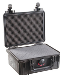
1150WF With Foam