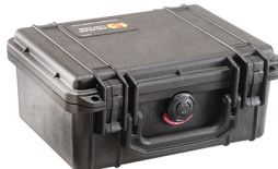
1150NF No Foam