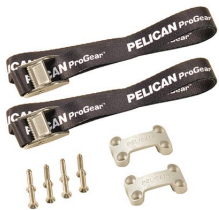
TDKIT Trousse de fixation