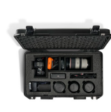
1535AV Universal Camera