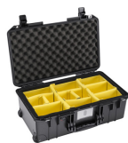
1535WD With Padded Dividers