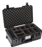
1535TP With TrekPak Divider System