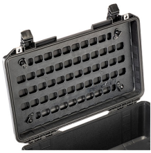
1535MP EZ-Click™ MOLLE Panel