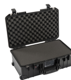
1535WF With Foam