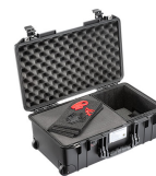
1535AIRTPF TrekPak / Foam Hybrid