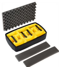
1535AirDS Cloison en mousse