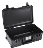
1535NF No Foam