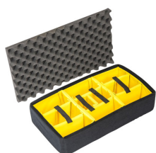
1555AirDS Cloison en mousse