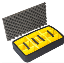
1555AirDS Cloison en mousse