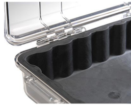
1011 Replacement Case Liner