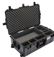
1615TP With TrekPak Divider System