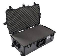
1615WF With Foam