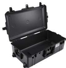
1615NF No Foam