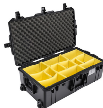
1615WD With Padded Dividers