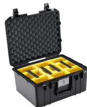
1557WD With Padded Dividers