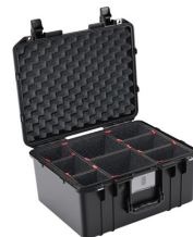
1557TP With TrekPak Divider System