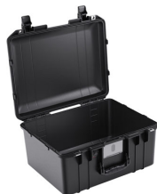
1557NF No Foam