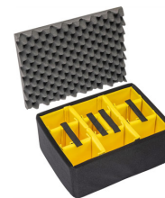
1557AirDS Divisores acolchados