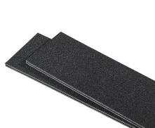
1557TPDIV Extra TrekPak Dividers