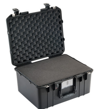
1557WF With Foam