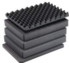
1557AirFS Juego de 5 piezas de espuma de recambio