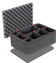
1557TPKIT Kit de divisores TrekPak