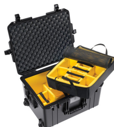
1607WD With Padded Dividers