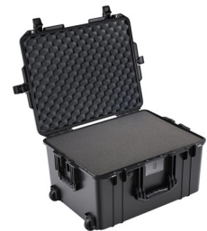
1607WF With Foam