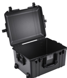
1607NF No Foam