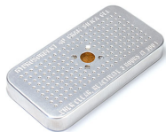
1500D Gel de sílice desecante