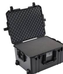
1607WF With Foam