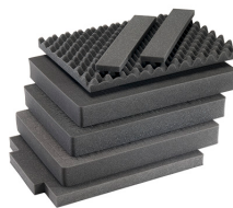
1607AirFS Juego de 7 piezas de espuma de recambio