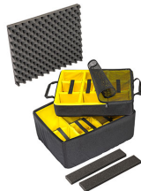
1607AirDS Divisores acolchados