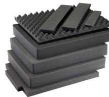
1637AirFS Juego de 8 piezas de espuma de recambio