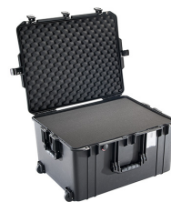
1637WF With Foam