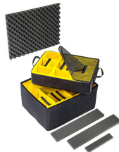
1637AirDS Divisores acolchados