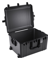
1637NF No Foam