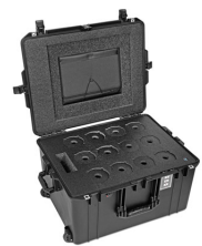
WINE-12B 12-Bottle Wine