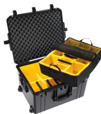
1637WD With Padded Dividers