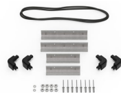
iM20XX-M4-BEZEL Bisel de la base (métrico)