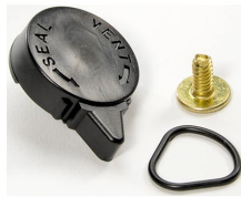
iM-VALVE-M-B Válvula de purga manual