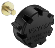
22-IM-VALVE Storm Case Automatic Purge Valve