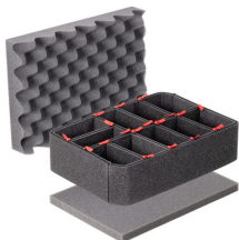
iM2100TPKIT Kit de divisores TrekPak