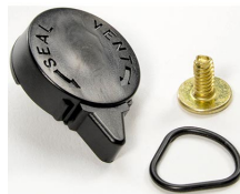
iM-VALVE-M-B Válvula de purga manual