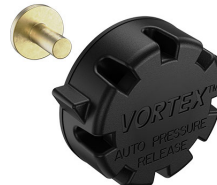
22-IM-VALVE Storm Case Automatic Purge Valve