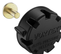
22-IM-VALVE Storm Case Automatic Purge Valve