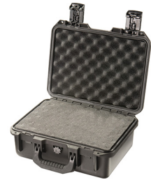
iM2100-X0001 With Foam