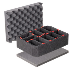
iM2100TPKIT Kit de divisores TrekPak