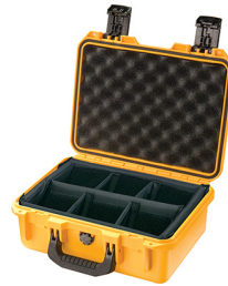
iM2100-X0002 With Padded Dividers