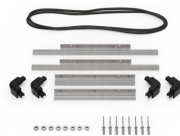
iM2200-BEZEL-LID Marco para instalaciones electrónicas con tapa