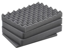
iM2200-FOAM Juego de 4 piezas de espuma de recambio