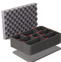
iM2200TPKIT Kit de divisores TrekPak