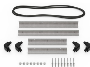
iM2200-BEZEL Kit de bisel para base