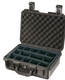
iM2200-X0002 With Padded Dividers