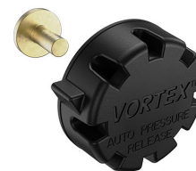
22-IM-VALVE Storm Case Automatic Purge Valve