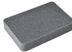
1032 Pick N Pluck™ Foam Insert