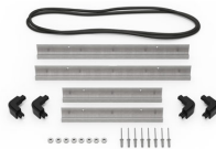
iM2300-BEZEL Kit de bisel para base