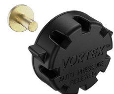
22-IM-VALVE Storm Case Automatic Purge Valve