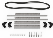
iM2300-BEZEL-LID Marco para instalaciones electrónicas con tapa