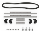
iM2306-BEZEL-LID Marco para instalaciones electrónicas con tapa