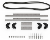
iM2306-BEZEL-LID Marco para instalaciones electrónicas con tapa