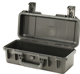
iM2306-X0000 No Foam