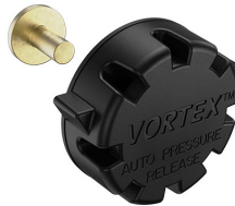
22-IM-VALVE Storm Case Automatic Purge Valve