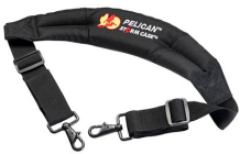
iM2370-STRAP-S Correa para hombro acolchada removible