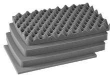
iM2370-FOAM Juego de 4 piezas de espuma de recambio