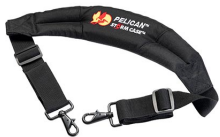
iM2370-STRAP-S Correa para hombro acolchada removible