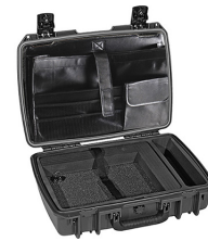
iM2370-X0003 Computer Case Deluxe