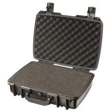
iM2370-X0001 With Foam