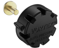
22-IM-VALVE Storm Case Automatic Purge Valve