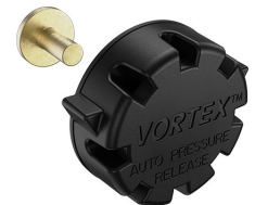
22-IM-VALVE Storm Case Automatic Purge Valve