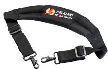
iM2370-STRAP-S Correa para hombro acolchada removible