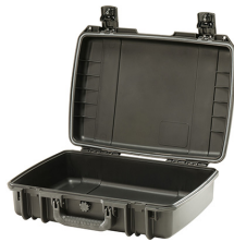
iM2370-X0000 No Foam