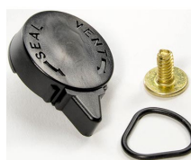
iM-VALVE-M-B Válvula de purga manual