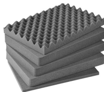
iM2450-FOAM Juego de 5 piezas de espuma de recambio