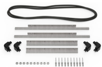
IM2450-BEZEL-LID Marco para instalaciones electrónicas con tapa