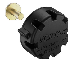
22-IM-VALVE Storm Case Automatic Purge Valve