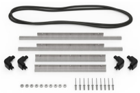
iM2450-BEZEL-LID Marco para instalaciones electrónicas con tapa