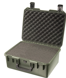
iM2450-X0001 With Foam