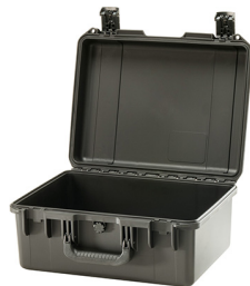
iM2450-X0000 No Foam