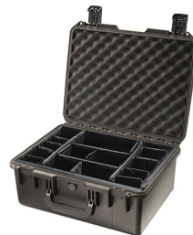
iM2450-X0002 With Padded Dividers