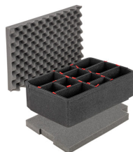
iM2620TPKIT Kit de divisores TrekPak