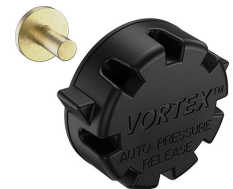
22-IM-VALVE Storm Case Automatic Purge Valve