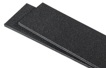
iM2620TPDIV Extra TrekPak Dividers