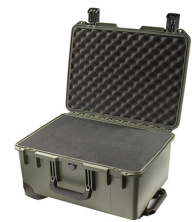
iM2620-X0001 With Foam