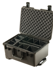
iM2620-X0002 With Padded Dividers