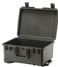
iM2620-X0000 No Foam