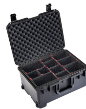
iM2620-X0006 With TrekPak Divider System