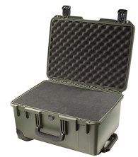
iM2620-X0001 With Foam