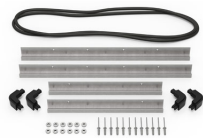
iM2620-BEZEL Kit de bisel para base