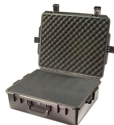
iM2700-X0001 With Foam