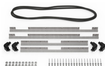
iM2700-BEZEL-LID Marco para instalaciones electrónicas con tapa