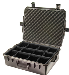
iM2700-X0002 With Padded Dividers