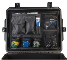
iM27XX-UTILITYORG Organizador de accesorios