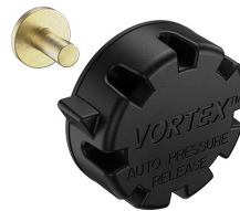
22-IM-VALVE Storm Case Automatic Purge Valve