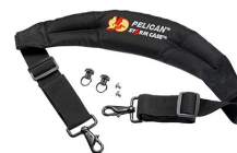
iM-STRAP-S-VER2 Correa para hombro acolchada