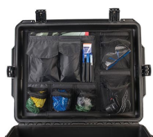
iM27XX-UTILITYORG Organizador de accesorios