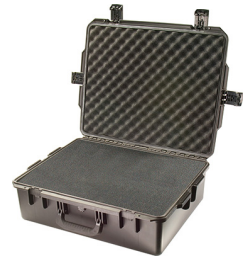
iM2700-X0001 With Foam