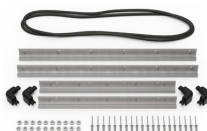
iM2700-BEZEL Kit de bisel para base