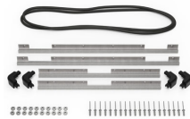
iM2700-BEZEL-LID Marco para instalaciones electrónicas con tapa