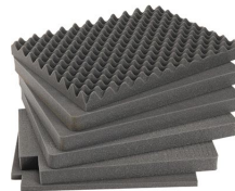
iM2720-FOAM Juego de 6 piezas de espuma de recambio