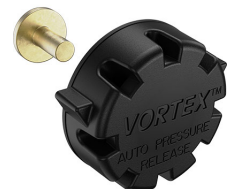
22-IM-VALVE Storm Case Automatic Purge Valve