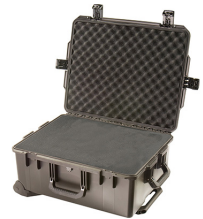
iM2720-X0001 With Foam