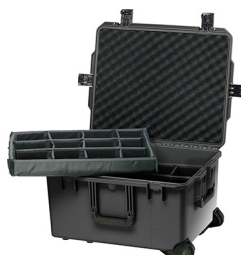
iM2750-X0002 With Padded Dividers