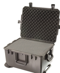
iM2750-X0001 With Foam