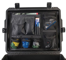
iM27XX-UTILITYORG Organizador de accesorios