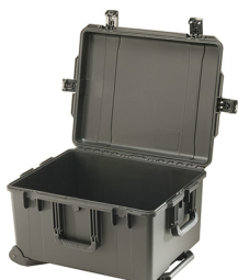
iM2750-X0000 No Foam