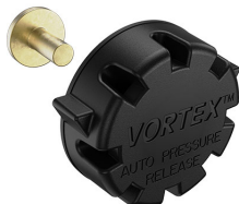
22-IM-VALVE Storm Case Automatic Purge Valve