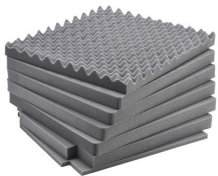
iM2875-FOAM Juego de 7 piezas de espuma de recambio