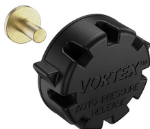
22-IM-VALVE Storm Case Automatic Purge Valve