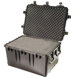
iM3075-X0001 With Foam