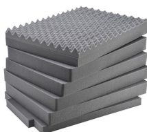
iM3075-FOAM Juego de 7 piezas de espuma de recambio