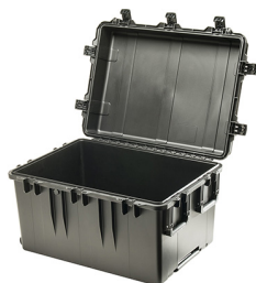
iM3075-X0000 No Foam