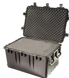
iM3075-X0001 With Foam