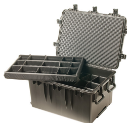
iM3075-X0002 With Padded Dividers