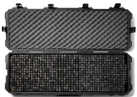
iM3200PRS iM3100 & iM3200 Storm RE-SET Kit