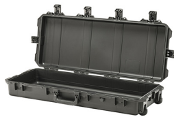
iM3100-X0000 No Foam