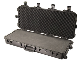
iM3100-X0001 With Foam