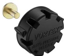
22-IM-VALVE Storm Case Automatic Purge Valve