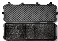
iM3200PRS iM3100 & iM3200 Storm RE-SET Kit