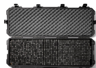
iM3200PRS iM3100 & iM3200 Storm RE-SET Kit