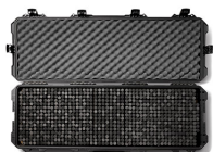
iM3200PRS iM3100 & iM3200 Storm RE-SET Kit