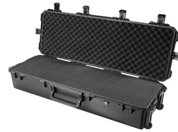
iM3220-X0001 With Foam