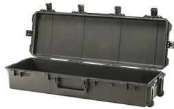
iM3220-X0000 No Foam