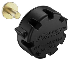
22-IM-VALVE Storm Case Automatic Purge Valve