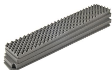
iM3410-FOAM Juego de 4 piezas de espuma de recambio