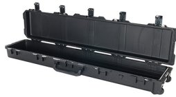
iM3410-X0000 No Foam