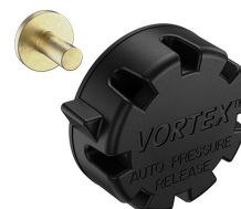
22-IM-VALVE Storm Case Automatic Purge Valve