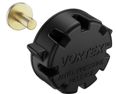
22-IM-VALVE Storm Case Automatic Purge Valve