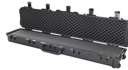
iM3410-X0001 With Foam