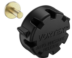
22-IM-VALVE Storm Case Automatic Purge Valve