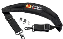
iM-STRAP-S-VER2 Correa para hombro acolchada