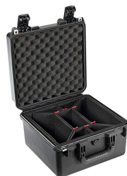
iM2275-X0006 With TrekPak Divider System