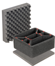
iM2275TPKIT Kit de divisores TrekPak