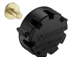
22-IM-VALVE Storm Case Automatic Purge Valve