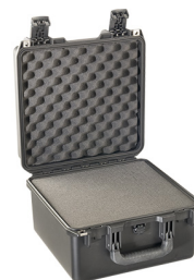
iM2275-X0001 With Foam