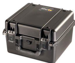
iM2275-X0000 No Foam