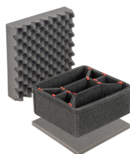
iM2275TPKIT Kit de divisores TrekPak