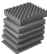
iM2275-FOAM Juego de 6 piezas de espuma de recambio