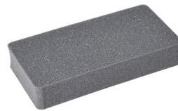
1062 Pick N Pluck™ Foam Insert