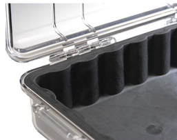
1061 Replacement Case Liner