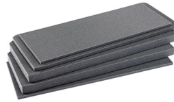
V700FS Juego de 4 piezas de espuma de recambio