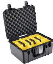
1507WD With Padded Dividers