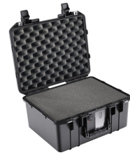
1507WF With Foam