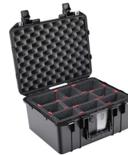
1507TP With TrekPak Divider System