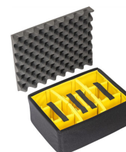
1507AirDS Divisores acolchados