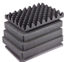
1507AirFS Juego de 5 piezas de espuma de recambio