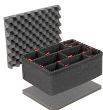
1507TPKIT Kit de divisores TrekPak