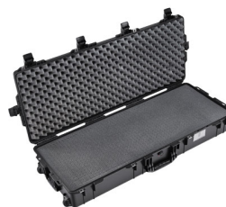
1745WF With Foam