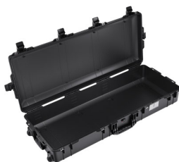
1745NF No Foam