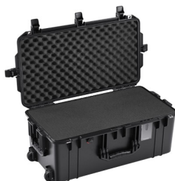
1606WF With Foam