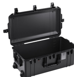
1606NF No Foam