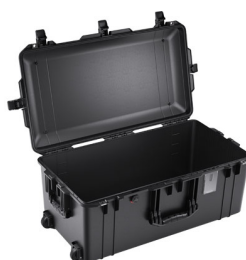
1626NF No Foam