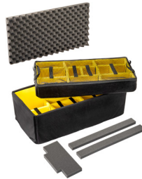
1626AirDS Divisores acolchados