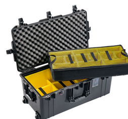
1626WD With Padded Dividers