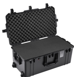
1626WF With Foam