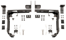
SDDLMT2A Saddle Case Bed Mount Kit for Bedrail Flange Mounting