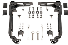
SDDLMT2B Saddle Case Bed Mount Kit for Toyota™ Tacoma™ Truck