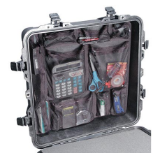
0359 Organizador de tapa