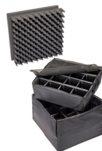
0355 Divisores acolchados