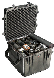
0354 With Padded Dividers