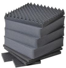
0351 Juego de 7 piezas de espuma de recambio