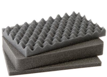
1171 Juego de 3 piezas de espuma de recambio