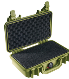
1170WF With Foam