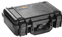
1170NF No Foam