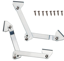
KIT-LIDSTAY-CARGO Cargo Lid Stays