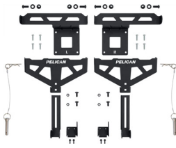
XBEDMT001C Cross-Bed Mount (Ford BoxLink)