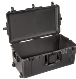
1646NF No Foam