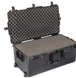
1646WF With Foam