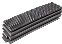
1755AirFS Juego de 4 piezas de espuma de recambio Air Case Soporte de techo para maletas